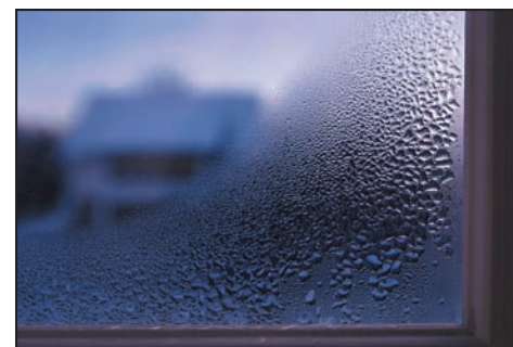
Condensación en el interior del vidrio de la ventana.