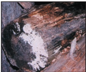
Moho creciendo sobre leña al exterior. Los mohos tienen varios colores, esta foto enseña ambos mohos blanco y negro.

Los mohos forman parte del medio ambiente natural. Al exterior, los mohos juegan un papel en la naturaleza al desintegrar materias orgánicas tales como las hojas que se han caído o los árboles muertos. No obstante, al interior, es necesario evitar el moho. Los mohos se reproducen mediante esporas; las esporas son invisibles a simple vista y flotan en el aire exterior e interior. Las esporas de mohos se hallan normalmente presentes en el aire exterior e interior. El moho puede crecer al interior cuando las esporas