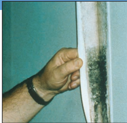
Moho creciendo detrás de un empapelado.

Sospecha de moho escondido Puede sospechar que existe moho escondido si un edificio huele a moho, pero que no puede ver su origen o si sabe que hubo daños causados por el agua y que los residentes se quejan de problemas de salud. El moho puede esconderse en lugares tales como la parte trasera de las planchas de yeso o drywall, empapelado, revestimientos de madera, la parte superior de baldosas de techo, la parte inferior de moquetas y tapices, etc. Las ubicaciones posibles del moho escondido incluyen zonas dentro de paredes alrededor de tuberías (con tuberías con pérdidas o condensación), la superficie de paredes detrás de muebles (en las que se forma condensación), en los conductos interiores, y en los materiales de techados encima de las baldosas de techos (debido a goteras en el techo o aislamiento insuficiente).