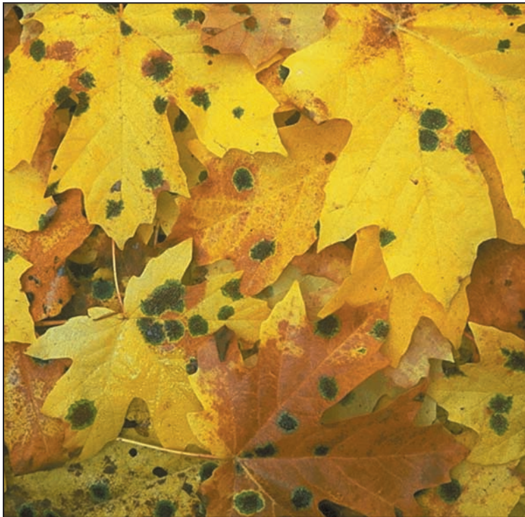
Moho creciendo en hojas caídas.

Se puede obtener este documento del sitio Web de la División para Medio Ambientes Interiores, EPA en www.epa.gov/mold