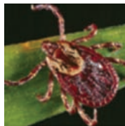
Garrapata americana del perro