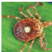
Garrapata estrella solitaria