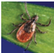
Garrapata de patas negras «del ciervo»