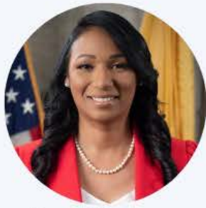
Assemblywoman Carmen Morales