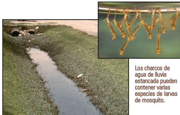
Los charcos de agua de lluvia estancada pueden contener varias especies de larvas de mosquito.

Si hubiera síntomas, estos se presentan entre los 3 y 14 días después de la picadura de un mosquito infectado.