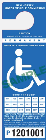
FIGURA 2: Cartel de persona con discapacidad permanente