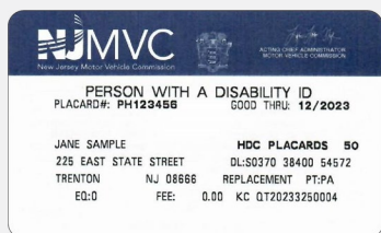
FIGURA 1: Tarjeta de identificación para personas con una discapacidad